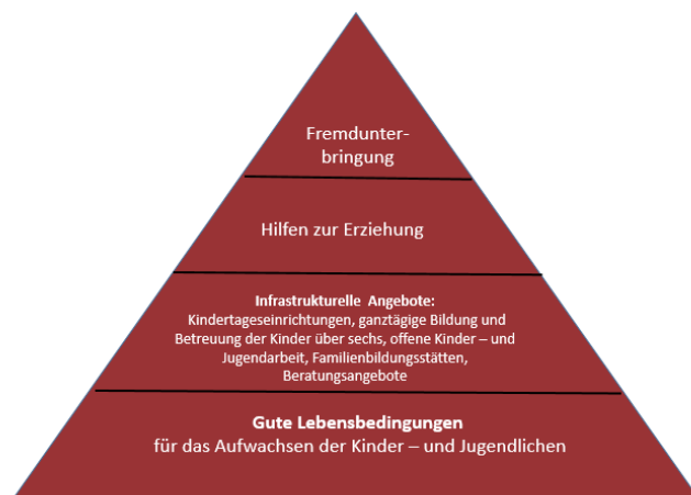
Abbildung 1: Prävention in der Kinder- und Jugendhilfe. Eigene Darstellung (vgl. Mike Vergeer, Marleen Beumer/ Deutsche Version: Frederick Groeger-Roth: Das CTC- Handbuch: Arbeiten mit Communities That Care, Hannover (2011))

Als sekundäre Prävention sind vorbeugende Hilfen in Situationen, die erfahrungsgemäß belastend sind und sich zu Krisen auswachsen können“ (8.Kinder- und Jugendbericht) zu verstehen. Als tertiäre Prävention definieren wir die Hilfen zur Erziehung, die jeweils mit den Familien, Kindern und Jugendlichen kooperativ entwickelt werden. Erst der letzte Schritt des Kinderschutzes stellt die Fremdunterbringung dar.